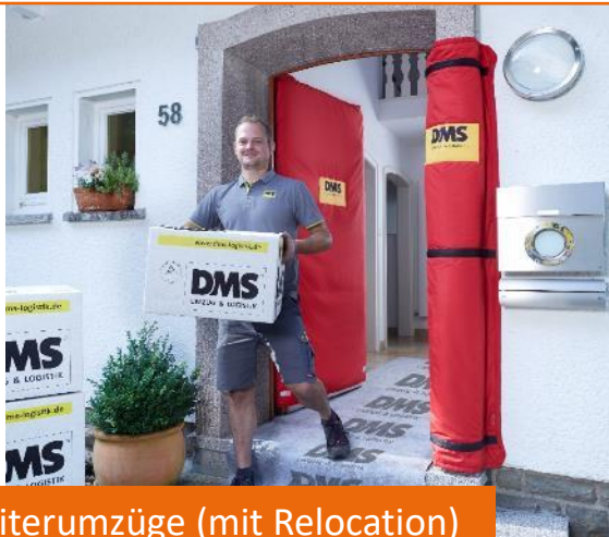
Mitarbeiterumzüge (mit Relocation)